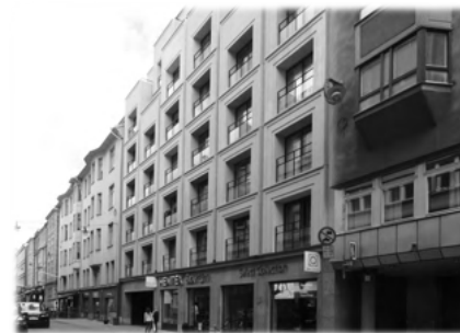
Kv. Riddaren 24, gatuhus 2015