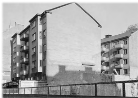
Kv. Riddaren 24, gatu- och gårdshus 1962