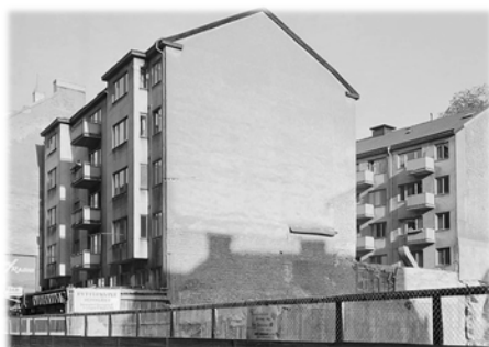
Kv. Riddaren 24, gatu- och gårdshus 1962